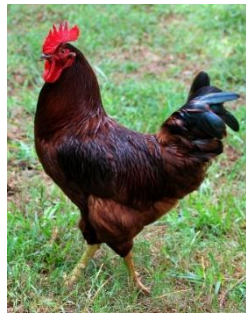
Rhode Island Red